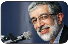
آیت الله قزوینی:

دکتر غلامعلی حداد عادل نماینده مجلس شورای اسلامی و عضو شورای عالی انقلاب فرهنگی که به منظور شرکت در مراسم سالگرد مرحوم سیدجلال یحیی زاده به یزد سفر کرده بود در حاشیه سفر خود، عصر جمعه ۲۲ فروردین سال جاری با تعدادی از اعضای بسیج اساتید دانشگاه یزد دیدار و گفتگو کرد. آقای دکتر حدادعادل با بیان اینکه وظیفه اصلی ما دانشگاهیان گفتمان سازی درباره اقتصاد مقاومتی است، بر نقش دانشگاهها در تحقق اقتصاد مقاومتی و حرکت به سمت تولید ثروت از طریق دانش و پژوهش تأکید کرد. وی خاطر نشان کرد: تنها راه رسیدن به توسعه پایدار، تکیه بر توانمندی های درونی نظام، پیشرفت علم و رهایی از وابستگی به صنعت نفت است.