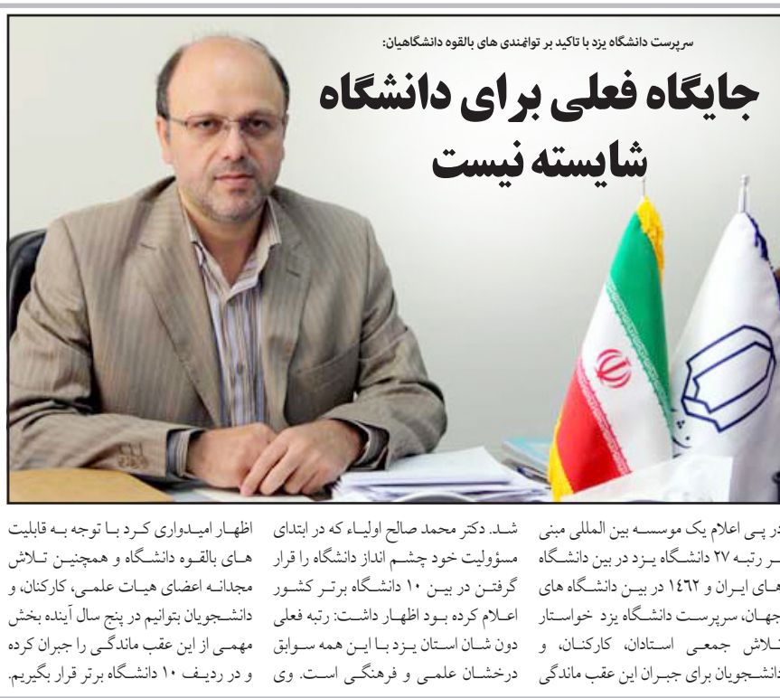
سرپرست دانشگاه یزد با تاکید بر توانمندی های بالقوه دانشگاهیان: