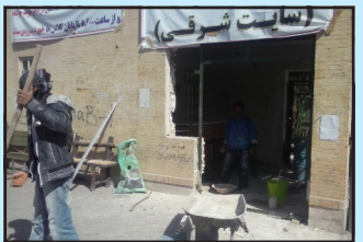
تعمیرات پردیس خوابگاهی ۲