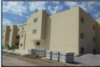
تعمیرات ساختمانی پردیس خوابگاهی ۱