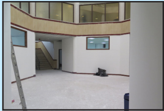
اجرای دیوار و سقف کناف استقلال