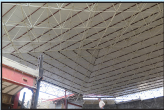
سقف سازه فضا کار آمفی تئاتر