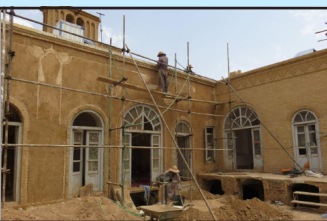
مرمت خانه شمسایی