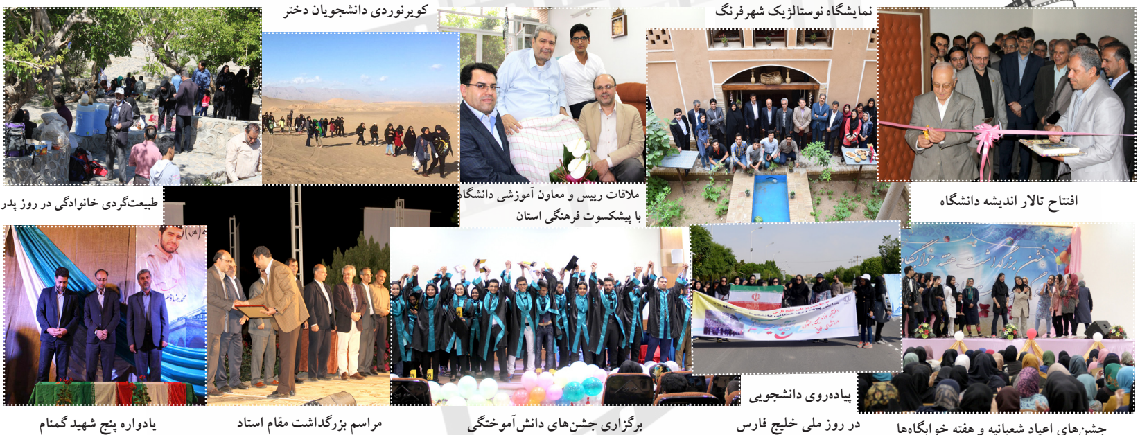
کویرنوردی دانشجویان دختر