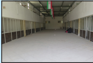
تعمیر و پارتیشن بندی سالن فجر