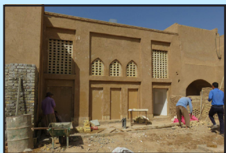
مرمت صحن شیرازی