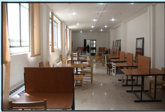
سالن کنفرانس بخش راست کتابخانه