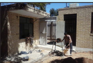
تعمیرات پردیس خوابگاهی ۱