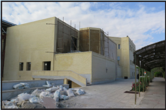
نماچینی ساختمان مرکزی