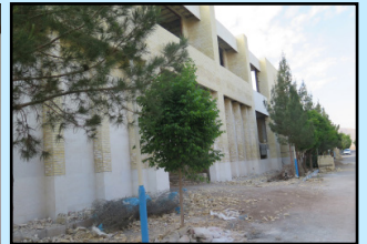
پروژه احداث ساختمان مهتاب