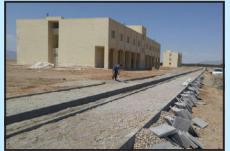
محوطه‌سازی خوابگاه ابرکوه