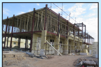
احداث ساختمان آموزشی علوم انسانی