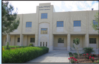
تکمیل آزمایشگاه مرکزی