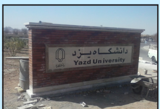
سازه معماری ورودی بصیرت