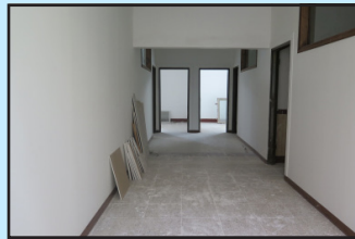
تعمیر و مرمت ساختمان‌های دانشگاه