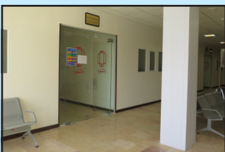
آماه‌سازی ساختمان مدیریت امور آموزشی