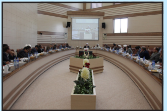
احداث تالار اندیشه