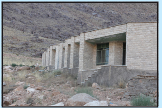
بازسازی تفرجگاه ده بالا