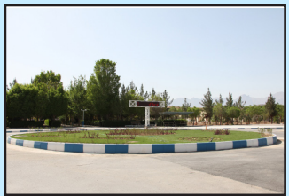
احداث و بهسازی میدان دانش