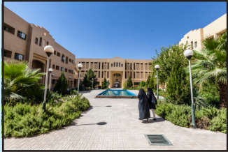
تعمیرات ساختمان‌های آموزشی