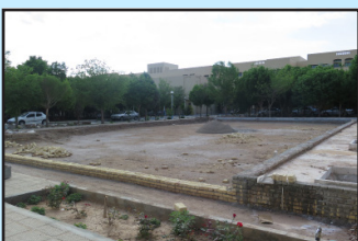
احداث صحن دانشجو