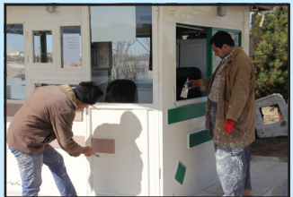
رنگ آمیزی اماکن