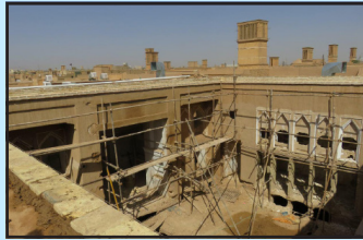
مرمت خانه نیک بین