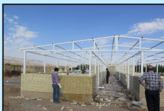
تکمیل ساختمان پژوهشی