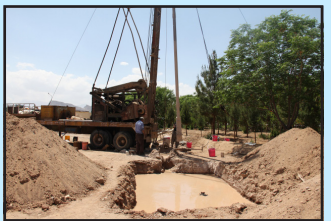
اجرای پروژه زمین گرمایی