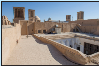
مرمت دانشکده هنر و معماری