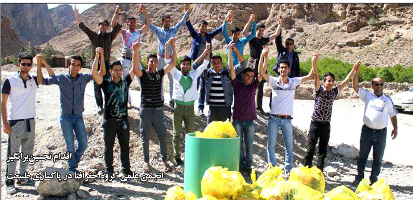
اقدامات تحسین بر انگیز انجمن علمی گروه جغرافیا در پاکسازی طبیعت

دانشسرای عالی یزد در سال ۱۳۵۵ تأسیس شد این دانشسرا در سال ۱۳۷۰ سه سال پس از تأسیس دانشگاه یزد در این دانشگاه ادغام شد و بر قدمت آن افزود. به همین مناسبت مراسم باشکوهی در سال جاری برگزار می‌شود. در این مراسم از کتاب تاریخچه دانشگاه و تمبر چهلیمین سال تأسیس دانشگاه رونمایی شده و نمایشگاهی از آثار و اسناد تاریخی دانشگاه نیز در معرض دید علاقه‌مندان قرار خواهد گرفت.