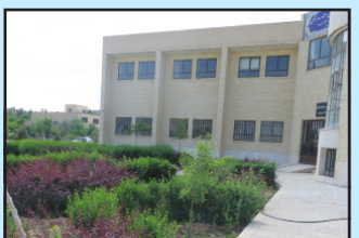
بهسازی مرکز مشاوره