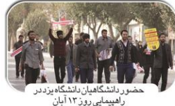
حضور دانشگاهیان دانشگاه یزد در راهپیمایی روز ۱۳ آبان