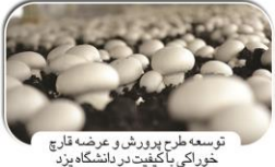
توسعه طرح پرورش و عرضه قارچ خوراکی با کیفیت در دانشگاه یزد