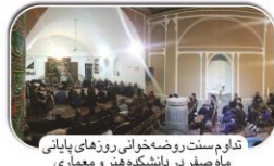
تداوم سنت روضه خوانی روزهای پایانی ماه صفر در دانشگاه هنر و معماری