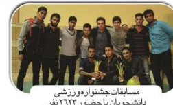
مسابقات جشنواره ورزشی دانشجویان با حضور ۲۲۲ نفر