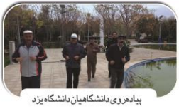
پداهدیرو دانشگاهیان دانشگاه یزد