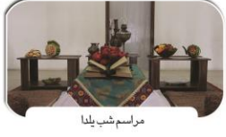
مراسم شب یلدا