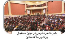
شب شعر قانوس در میان استقبال پرشور علاقه مندان