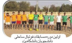
اولین دوره مسابقات فوتبال ساحلی دانشجویان دانشگاه یزد