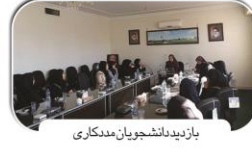
بازدید دانشجویان مددکاری