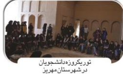
توریکروزه دانشجویان در شهرستان مهریز