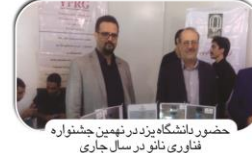
حضور دانشگاه یزد در نهمین جشنواره فناوری نانو در سال جاری