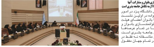
نوآرندسازی بانوان و مشارکت آنها در تمام عرصه های جامعه بشری است

اخلاق تعلیم و تربیت مهمترین وجه آموزش عالی حجت الاسلام دکتر مسعود آذربایجانی قائم مقام پژوهشگاه حوزه و دانشگاه در پنجمین نشست اخلاق تعلیم و تربیت در دانشگاه یزد گفت: موضوع اخلاق تعلیم و تربیت یکی از اساسی ترین حوزه های عمل و نظر است. توجه به این حوزه می تواند متشابه تغییرات مثبتی در امر آموزش عالی باشد.