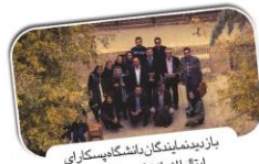
بازدید نمایندگان دانشگاه های استان از ایستگاه کتاب در دانشگاه هنر و معماری