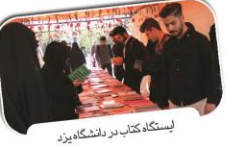
لیستگاه کتاب در دانشگاه یزد