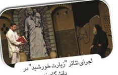
اجرای تئاتر «زیارت خورشید» در دانشگاه امیر