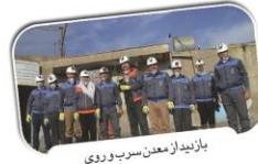
بازدید از معدن سرب و روی