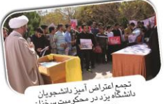
تجمع اعتراضی دانشجویان دانشگاه یزد در محکومیت سخنان رییس جمهور آمریکا