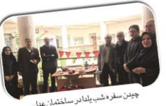
چندین سفره شب یادمان ساختمان عدل