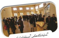
نمایشگاه عکس «استندایتمی»