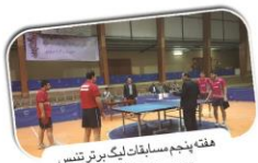
هفته پنجم مسابقات لیگ برتر تنیس روی میز باشگاه های کشور