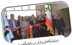
نمایشگاه فن بازار در دانشگاه یزد