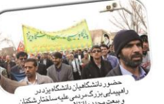
حضور دانشجویان دانشگاه یزد در راهپیمایی بزرگ مردمی علیه سناختل سخنان و بیعت مجدد با لاقاب و ولایت فقیه