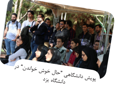
پوشش دانشگاهی "حال خوش خواندن" در دانشگاه یزد