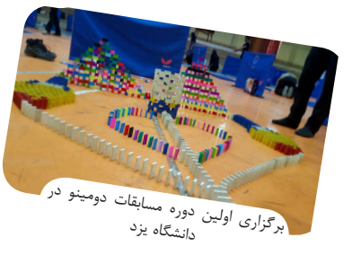
برگزاری اولین دوره مسابقات دومینو در دانشگاه یزد