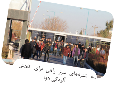
سه شنبه‌های سبز راهی برای کاهش آلودگی هوا