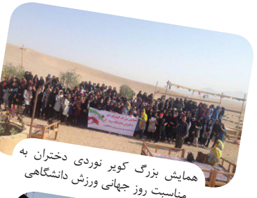
همایش بزرگ کویر نوردی دختران به مناسبت روز جهانی ورزش دانشگاهی