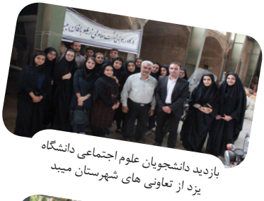
بازدید دانشجویان علوم اجتماعی دانشگاه یزد از تعاونی های شهرستان میبد