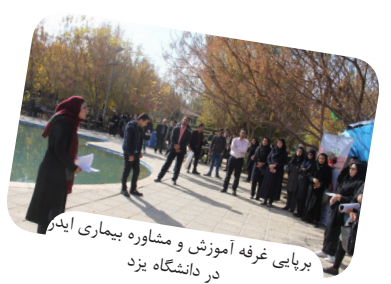
برایابی غرفه آموزش و مشاوره بیماری ایدز در دانشگاه یزد