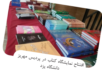
افتتاح نمایشگاه کتاب در پردیس مهریز دانشگاه یزد