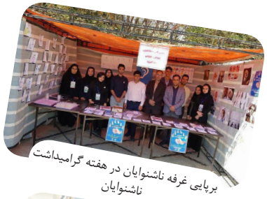
برایابی غرفه ناشنوایان در هفته گرامیداشت ناشنوایان