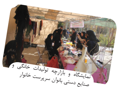
نمایشگاه و بازارچه تولیدات خانگی و صنایع دستی بانوان سرپرست خانوار