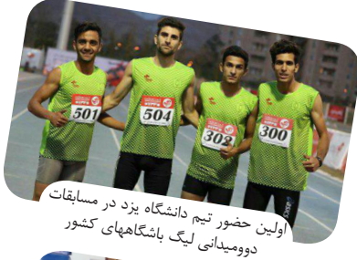
اولین حضور تیم دانشگاه یزد در مسابقات دوومیدانی لیگ باشگاههای کشور