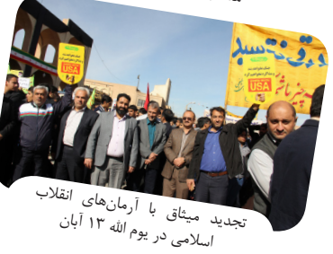
تجدید میثاق با آرمان‌های انقلاب اسلامی در یوم الله ۱۳ آبان