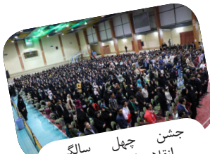
جشن چهل سالگی انقلاب اسلامی ایران