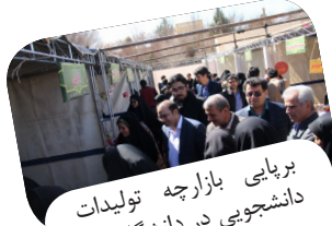
برپایی بازارچه تولیدات دانشجویی در دانشگاه یزد