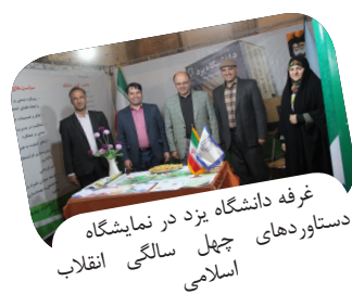
غرفه دانشگاه یزد در نمایشگاه دستاوردهای چهل سالگی انقلاب اسلامی