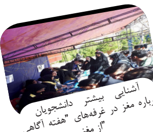
آشنایی بیشتر دانشجویان درباره مغز در غرفه های "هفته آگاهی از مغز"