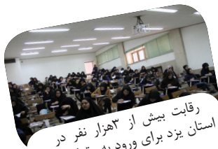
رقابت بیش از ۳ هزار نفر در استان یزد برای ورود به مقطع دکترا