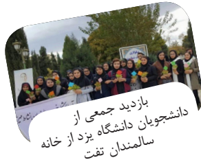
بازدید جمعی از دانشجویان دانشگاه یزد از خانه سالمندان تفت