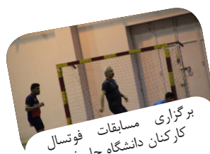
برگزاری مسابقات فوتسال کارکنان دانشگاه جام فجر