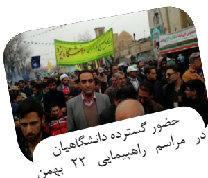
حضور گسترده دانشگاهیان در مراسم راهپیمایی ۲۲ بهمن