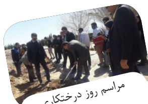
مراسم روز درختکاری