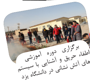
برگزاری دوره آموزشی اطفاء حریق و آشنایی با سیستم های آتش نشانی در دانشگاه یزد